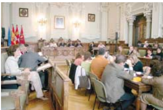
Corporación Municipal de Valladolid.

Son parte integrante del Estado y conforman uno de los tres niveles de su Estructura Administrativa, gozando de plena autonomía en las funciones que les son propias y no siendo en ningún caso Instituciones de ámbito Autonómico. ■