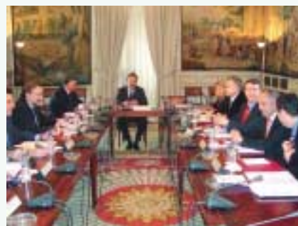
La Comisión de Seguimiento durante su última reunión.

Por lo que se refiere a las relaciones entre las fuerzas políticas y el transfuguismo, el PSOE ha perdido 19 Alcaldías desde las elecciones de mayo de 2003 por casos de transfuguismo, el PP, 10. También CiU e IU han perdido dos Alcaldías cada una. El PP ha ganado 18 Alcaldías, y el PSOE, seis.