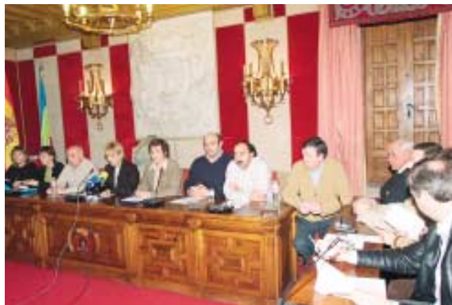
La Corporación Municipal de Camargo (Cantabria).