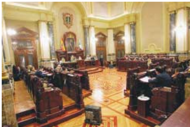
Sesión Plenaria del Ayuntamiento de La Coruña.

El reconocimiento constitucional de los municipios, de las provincias e islas como nivel de gobierno territorial autónomo requiere para su efectividad, el establecimiento de un ámbito competencial propio, que les permita gestionar una parte importante de los asuntos públicos bajo su propia responsabilidad y en beneficio de sus vecinos, así como un sistema de financiación que les garantice recursos suficientes para su adecuado ejercicio. España debe aplicar los principios de autonomía local suscritos en los tratados internacionales representados por nuestro país, tal como la Carta Europea de Autonomía Local.