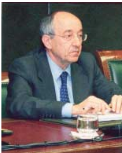
Miguel Ángel Fernández Ordóñez, Secretario de Estado de Hacienda y Presupuestos.

Por otro lado, se refirió a la compensación a los municipios por la supresión