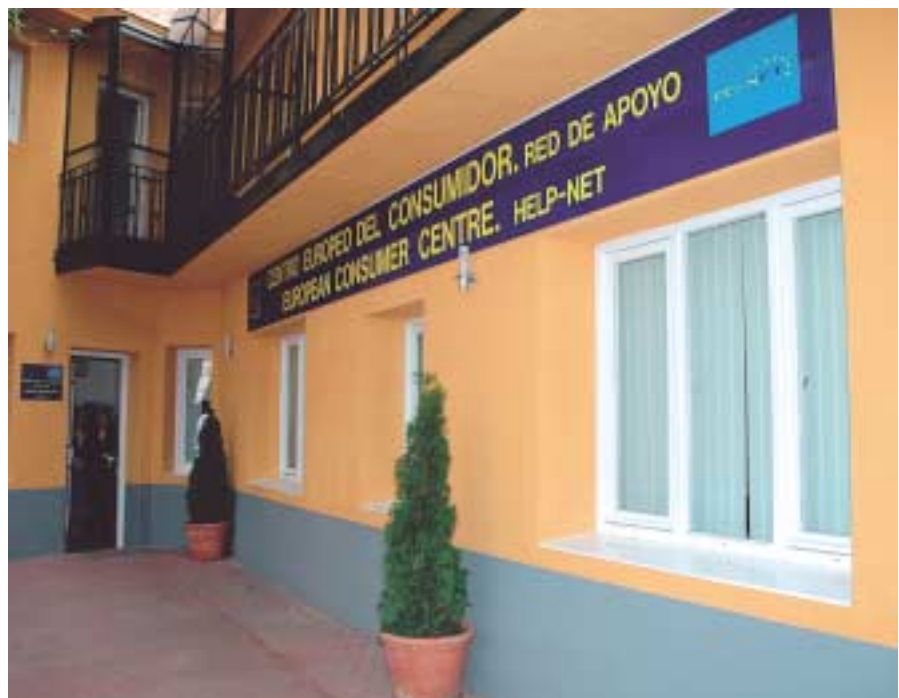
Sede del Centro, en Madrid.

Los Centros Europeos del Consumidor aportan a éste una información útil y relevante acerca de sus derechos y obligaciones, en relación con las necesidades que, en materia de consumo durante sus desplazamientos por el territorio