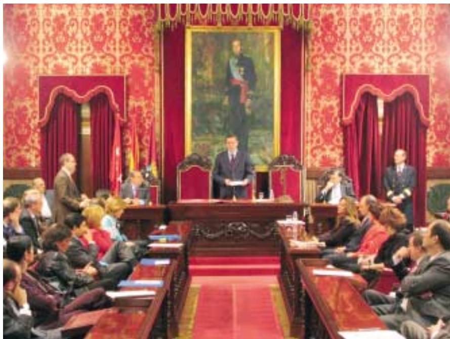
Pleno del Ayuntamiento de Madrid.

La gran mayoría de las Corporaciones Locales españolas secundaron el martes, 19 de abril, la iniciativa propuesta por la FEMP de celebrar Plenos Extraordinarios de carácter monográfico para adherirse a la llamada Carta de Vitoria, el documento elaborado por la Federación en la capital vasca durante el pasado mes de noviembre, en el transcurso de los actos conmemorativos del XXV Aniversario de las primeras Corporaciones Locales elegidas democráticamente.