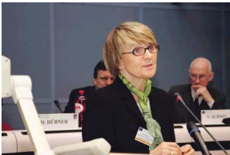
La Comisaria Europea, Danuta Hubner, que explicó a los miembros del CdR las perspectivas de los Fondos.

La discusión y aprobación de los Dictámenes relativos a los Reglamentos que regirán el Fondo Europeo de Desarrollo Regional (FEDER), el Fondo Social Europeo (FSE) y el Fondo de Cohesión, centraron los debates que los miembros del Comité de las Regiones (CdR) mantuvieron en Bruselas los pasados días 13 y 14 de abril, durante su 59 Sesión Plenaria. La representación española en este Comité está integrada por 21 miembros de los que cuatro son electos locales.