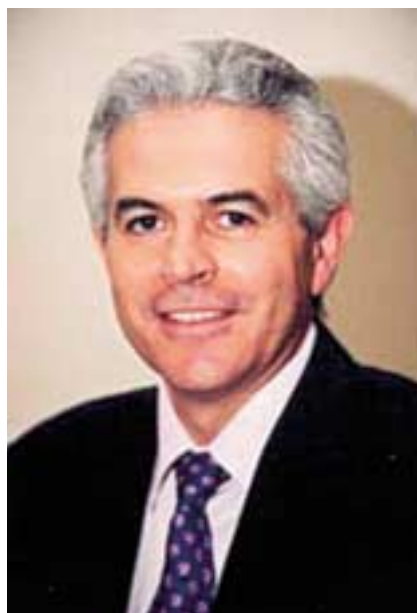
El Secretario de Estado de Telecomunicaciones y para la Sociedad de la Información, Francisco Ros.

El Programa busca extender la banda ancha a todo el territorio español en unas condiciones técnicas y económicas similares a las existentes en las zonas urbanas, a finales de 2008