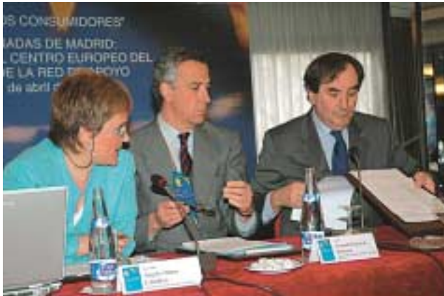
Apertura de la Jornada.

Al comienzo del pasado mes de abril se celebraron en Madrid las Jornadas de presentación del Centro Europeo del Consumidor y la Red de Apoyo al Consumidor Europeo, una iniciativa orientada a dar a conocer a los consumidores y usuarios europeos cuáles son sus derechos y cuáles los mecanismos disponibles para hacerlos efectivos en cualquiera de los Estados de la Unión. En el encuentro se dieron a conocer tanto la organización como el funcionamiento y competencias del Centro Europeo del Consumidor en España, como la coordinación establecida con la Red de Apoyo Europea. Ponencias, comunicaciones y debates sobre las reclamaciones transfronterizas –que representan la base de la Red de Apoyo de los Centros Europeos del Consumidor– y sobre la información y concienciación del consumidor, constituyeron el cuerpo principal de las dos Jornadas a lo largo de las cuales se prolongó el trabajo.